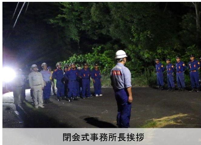
閉会式事務所長挨拶