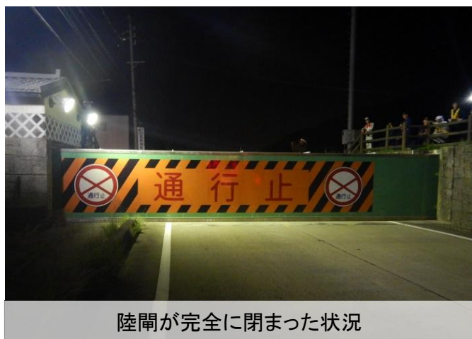
陸閘が完全に閉まった状況